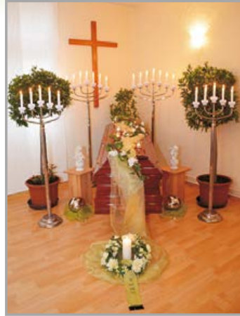
Eigener Abschiedsraum für Trauerfeiern.

Der letzte Liebesdienst ist es den Abschied von einem geliebten Menschen so zu gestalten wie er es sich selbst gewünscht hätte. Wir unterstützen Sie dabei mitfühlend, kompetent und fair.